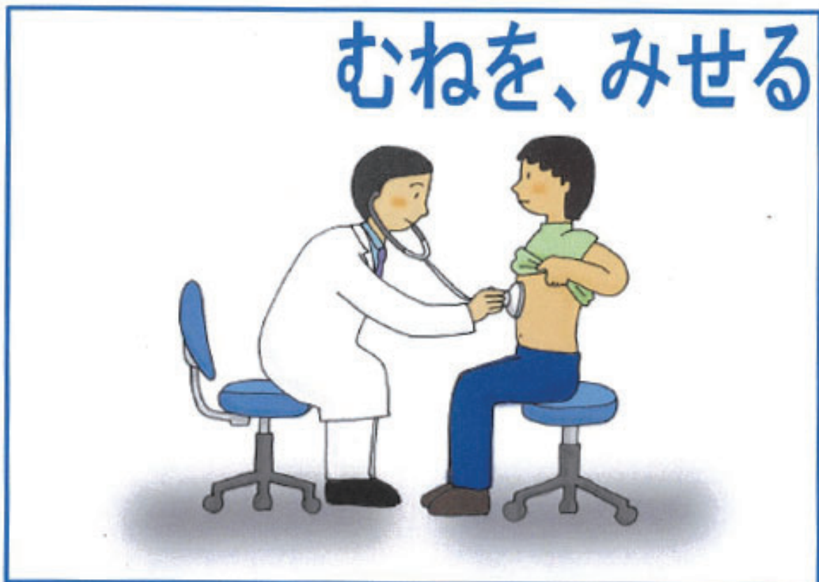
(2) 胸部聴診 正面)